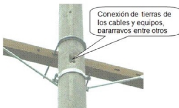
Figura No. 4. Conexiones inferior y superior al electrodo de Puesta a