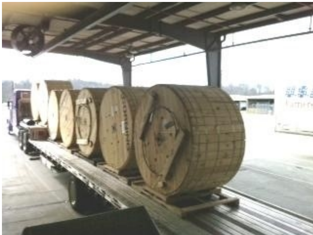
Figura 3: Carrete(imagen de referencia)

• El cable deberá ser empacado para embarque en un carrete de madera no retornable. Para mayor protección los carretes de madera deberán tener un revestimiento adicional que le ofrece al cable mayor protección durante la transportación. “Reel Lagging” según la siguiente figura: