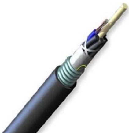
Figura 2: Composición del cable(imagen de referencia)

Cada capa de tubos holgados debe ir asegurada al miembro central dieléctrico con hilos de poliéster u otro sistema sin aplastar los tubos holgados.