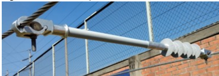
Figura 2. Foto ilustrativa separador de fases