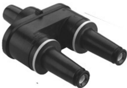
Figura 1. Adaptador tipo feed thru insert con soporte

Establecer las especificaciones técnicas que deben cumplir los adaptadores con norma IEEE standard 386 de 15 kV (tipo feed thru insert) utilizados en la conexión entre terminales tipo codo y los bujes tipo pozo en el sistema de distribución de Enel Colombia S.A. ESP.