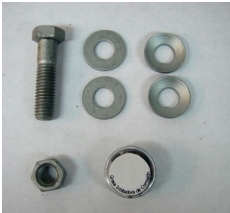
FIGURA 2 COMPONENTES DEL SISTEMA DE APRIETE PARA SUPERFICIES PLANAS EN BT