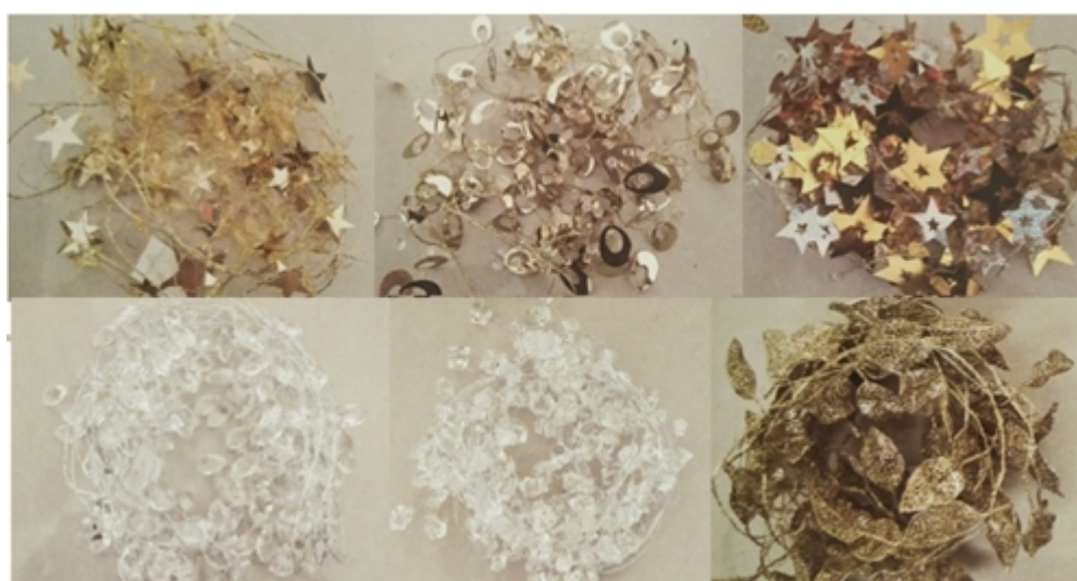
STRING LIGHT DECORATION