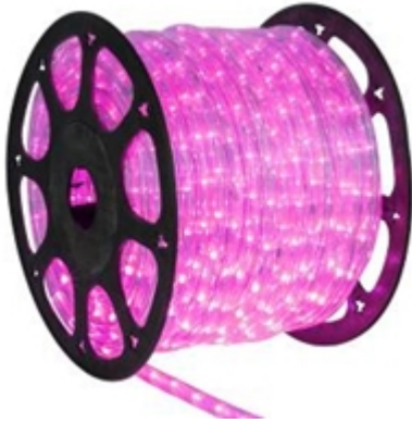
IMAGEN DE REFERENCIA DE MANGUERA CON BOBINA DE PLÁSTICO

Para el caso de la unidad contenedor del carrete, se requiere que sea una caja de cartón y que en su exterior esté etiquetada de la siguiente manera: