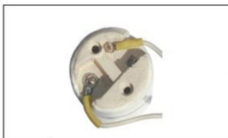
FIJACIÓN DE LOS CONDUCTORES