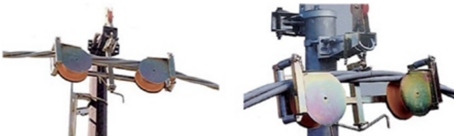
Figura 3. Poleas para estructuras de suspensión

Cabrestante Motorizado. Requerido para tensionar el cable.