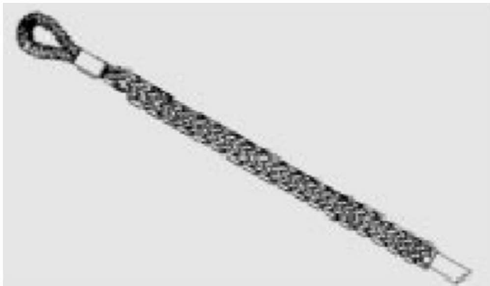
Figura 5. Malla de tracción

Malla de tracción o manguito de tracción