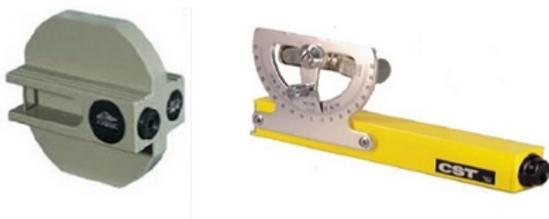
Figura 5b. Nivel de mano - Eclímetro óptico

Durante el proceso de tendido se debe cumplir con el radio de curvatura el cual debe ser 12 veces el diámetro exterior nominal del cable cuádruplex. Por ejemplo para un cable de 150 \text{ mm}^2 el radio de curvatura aplicable en el proceso de tendido es de 66 cm.