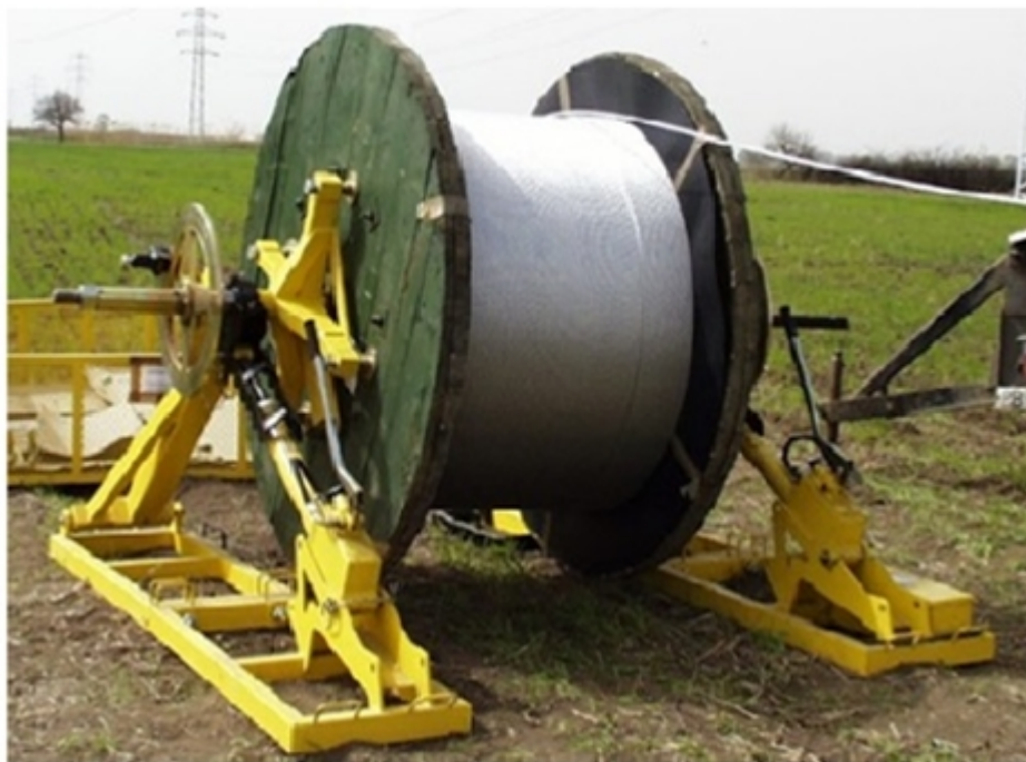
Figura 1. Bobina conductor con sistema de frenado