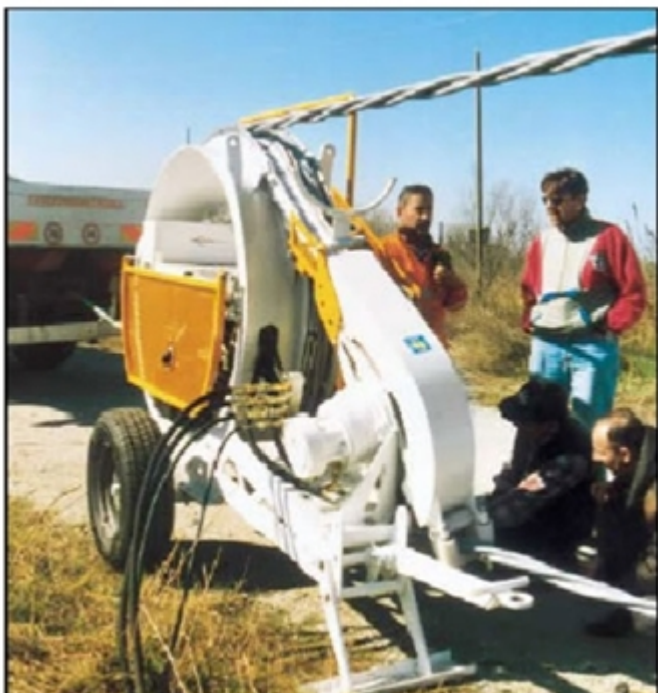
Figura 4. Cabrestante motorizado

Malla de tracción o manguito de tracción