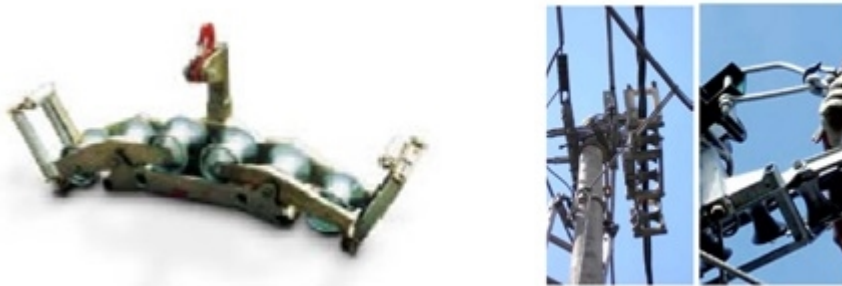
Figura 2. Poleas para estructuras de retención