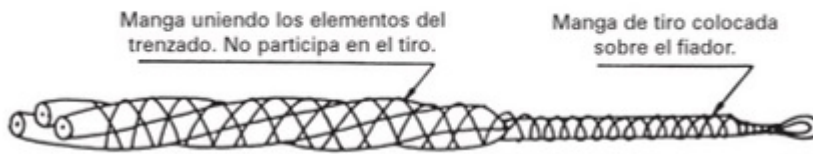
Figura 5a. Malla de halado fiador

Dinamómetro Digital. Requerido para visualizar la tensión de tendido del cable cuadruplex