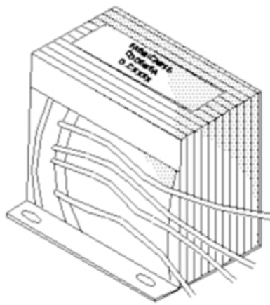
A Balasto Reactor