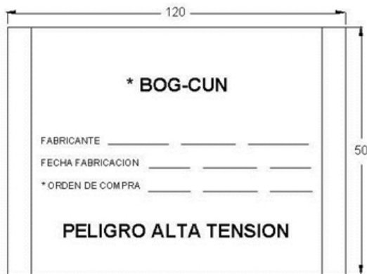
VISTA EN PLANTA