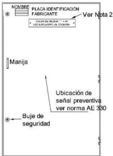
VISTA FRONTAL CON PUERTA EXTERIOR