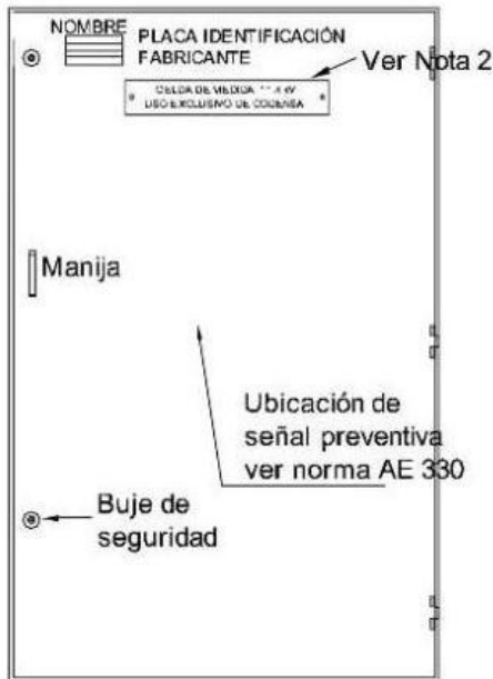
VISTA FRONTAL CON PUERTA EXTERIOR